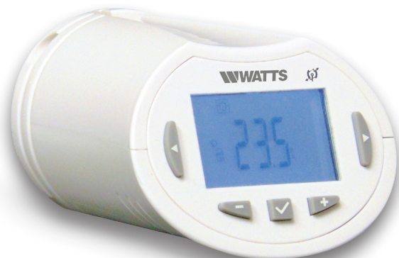
WATTS® Vision BT-TH02 RF