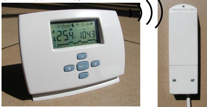
MILUX RF (Πομπές)